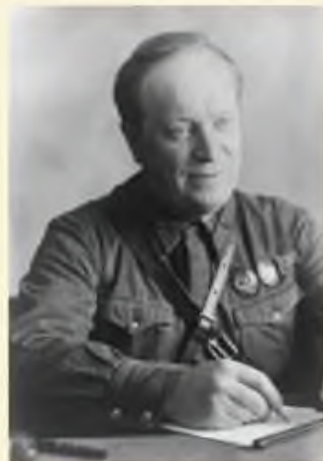
Автор текста поэт В.И. Лебедев- Кумач