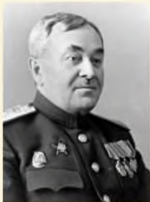
Автор музыки А.В. Александров