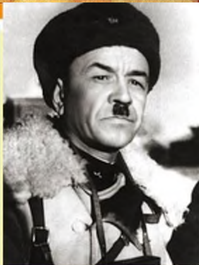
Панфилов Иван Васильевич- генерал-майор

28 пехотинцев из стрелковой дивизии генерала И. В. Панфилова у разъезда Дубосеково вступили в бой против 50 фашистских танков и не пропустили их к Москве.