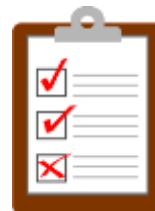
информационные листы и объявления