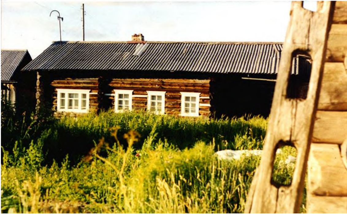
Зимняя изба Абрамовых